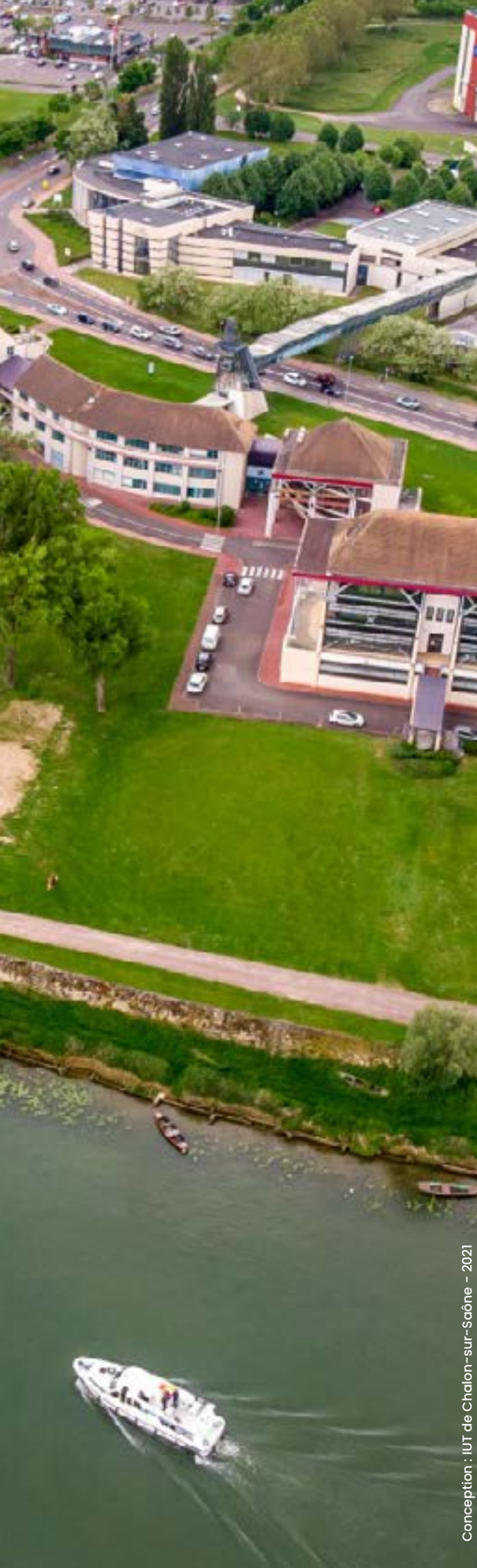
Conception : IUT de Chalon-sur-Saône - 2021